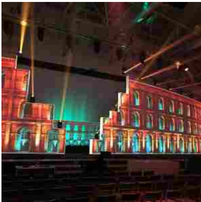
Una scenografia allestita alla Fiera di Roma per il congresso europeo di cardiologia

Viviamo più a lungo e oltre 16mila italiani hanno superato i 100 anni di vita, numero più che raddoppiato negli ultimi 10 anni (erano solo 6.100 nel 2002). A loro si aggiunge un gruppo sempre crescente di super centenari. Il merito è anche della dieta mediterranea, ma ci sono alcune cattive abitudini che mettono a rischio il nostro cuore: la sedentarietà, che rappresenta la quarta causa di mortalità e disabilità in Occidente, e il fumo che è la causa principale di infarto e di malattie coronariche in uomini